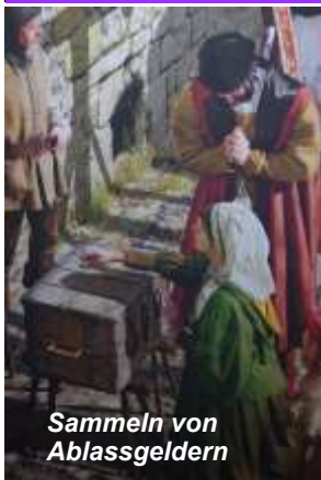
Sammeln von Ablassgeldern

Die Faust mit dem kreuzförmigen Ring am Finger verdeutlicht die Ambivalenz: Einerseits zeigte Martin Luther Stärke vor Kaiser und Reich, andererseits führte die Kirchenspaltung zu Krieg und Gewalt. (Plakat zur Kunstaussstellung in Wittenberg)