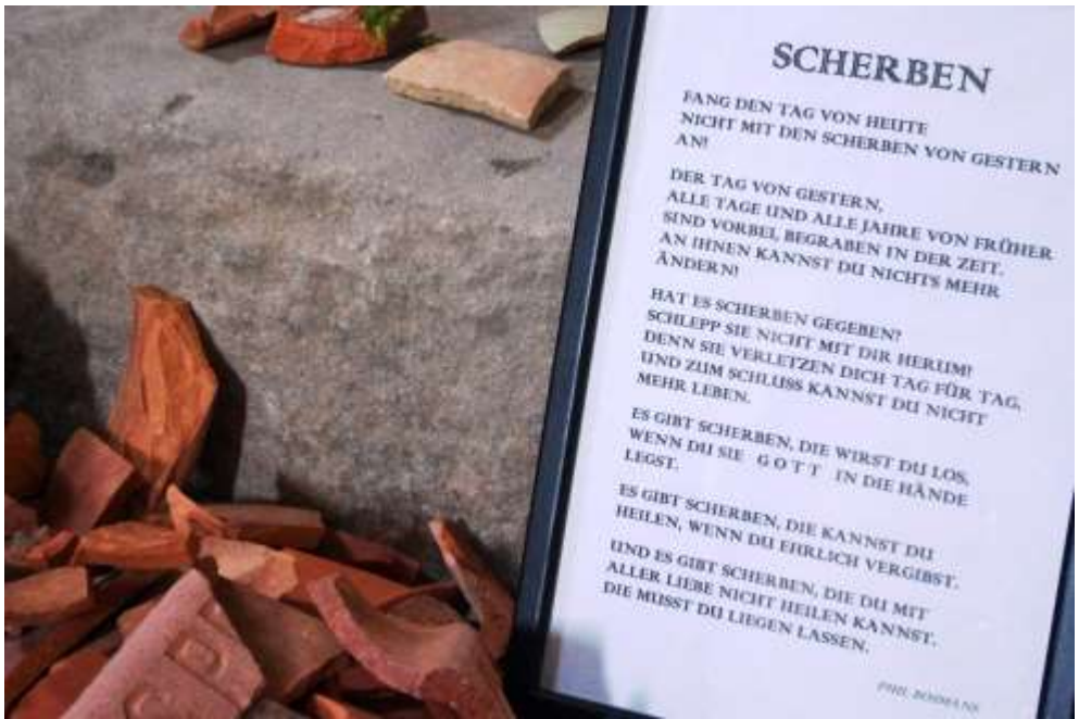
Stationen in der Klosterkirche Ebrach: „Dankstelle“, Scherben, Ökumene, Gebetsbaum