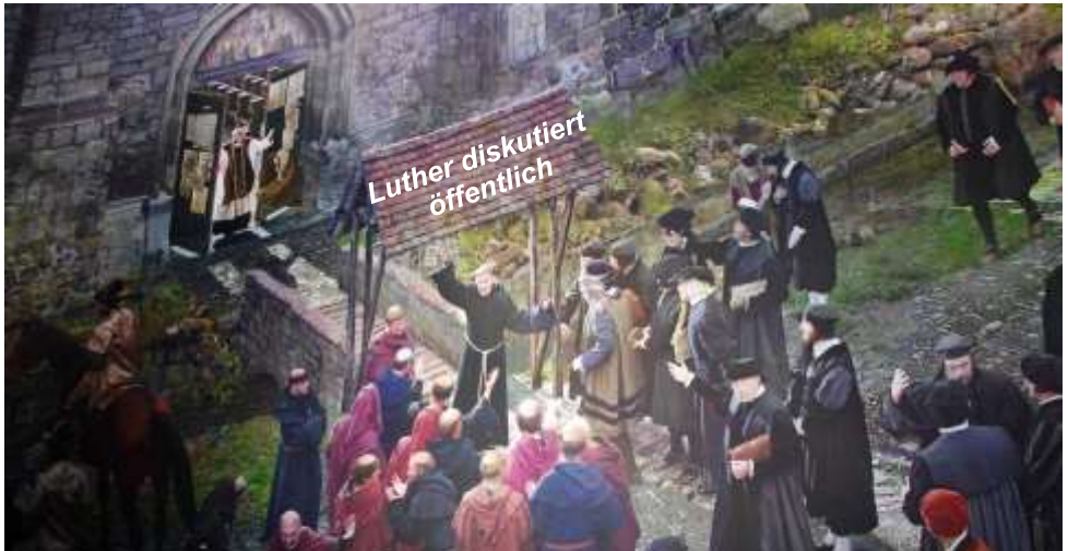
Luther diskutiert öffentlich

Vier Szenen aus dem Rundbild von Yadegar Asisi in Wittenberg.