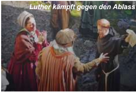
Luther kämpft gegen den Ablass