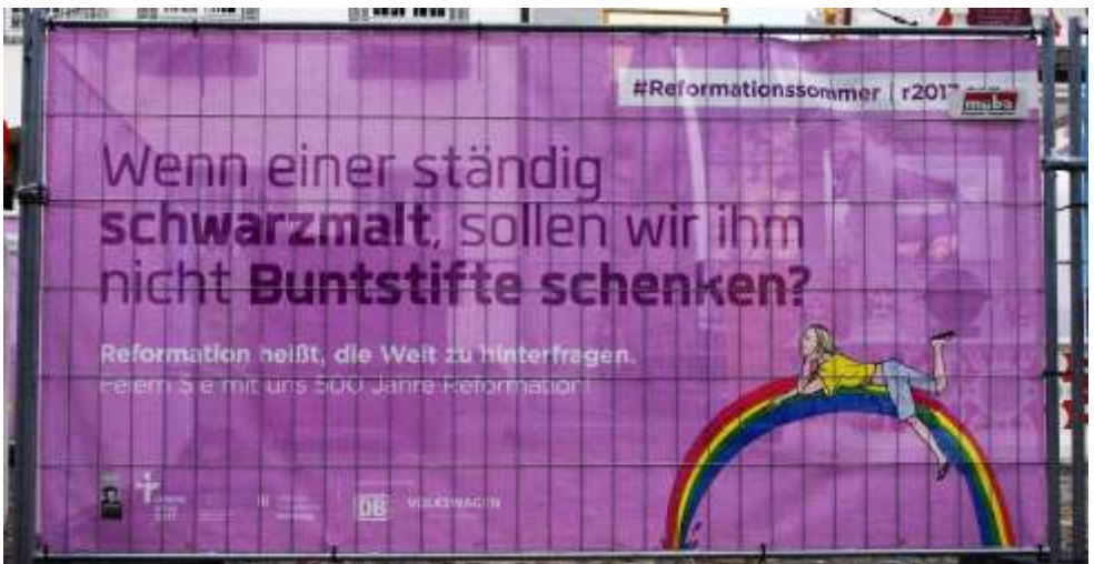
Banner auf der Weltausstellung in Wittenberg

Die Bücherstube im CJVM-Haus Haag hat an allen Samstagen von 14 bis 16 Uhr geöffnet. Weitere Infos: Irene Link, Tel. 09556 1416