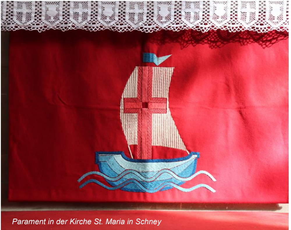
Parament in der Kirche St. Maria in Schney